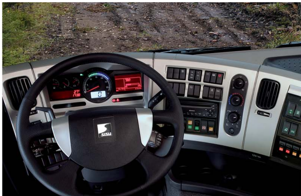
Новая кабина – простор, комфорт и удобство в использовании

В автомобилях Sisu Timber используются новые, стильные и эргономичные кабины со спальным местом. Водитель получает значительно лучший обзор. Чтобы вы не отвлекались от управления автомобилем и ощущение комфорта не покидало вас, сиденье водителя оснащено различными регулировками. Дизайн изогнутой панели приборов стал не только современнее, но и элегантнее. Другим несомненным плюсом объемной кабины стали многочисленные отсеки для хранения бумаг и вещей.