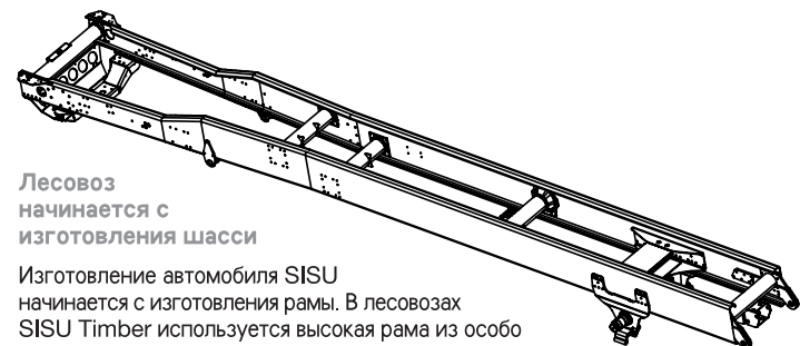
Лесовоз начинается с изготовления шасси

SISU Timber – это единственный автомобиль на рынке лесовозной техники, который выходит с завода в полной комплектации. Наш автомобиль – это не стандартное шасси, на базе которого в последствии просто устанавливается лесовозное оборудование. В автомобиле SISU Timber установлен новый двигатель Caterpillar C 13 – мощный, экономичный и надежный даже в труднопроходимых дорожных условиях. Из вариантов колесной формулы можно выбрать как популярные 6x2, 6x4 или более специфичные четырехосные версии, так и другие варианты.