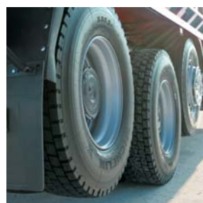
Задняя тележка SISU – подъем моста

На SISU Timber есть возможность установить заднюю тележку SISU с механизмом отключения привода и подъема заднего моста. Подъем моста возможен и при движении полностью груженого автомобиля. Такая комбинация подъемной самой задней оси и передних колес,